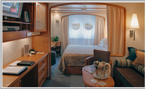
Lugar dekk 2 kr 39 950 pr person inkl. havneavgift