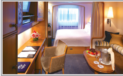
Lugar dekk 3 kr 46 650 pr person inkl. havneavgift