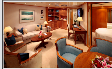
Owner Suite dekk 3 kr 85 000 pr person inkl. havneavgift