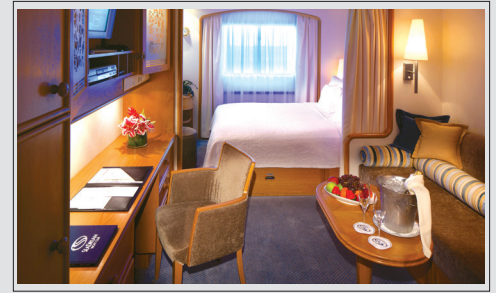
Lugar dekk 4 kr 49 950 pr person inkl. havneavgift