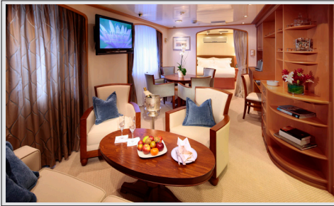
Admiral Suite dekk 4 kr 80 000 pr person inkl. havneavgift